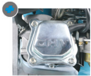
Sistema OHV: motor con válvulas en culata