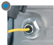
Seguridad falta de aceite