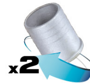
2 racores 2"