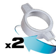
2 bridas de fijación