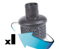
1 filtro con soporte